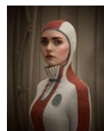
Titelbild: Christian Tagliavini